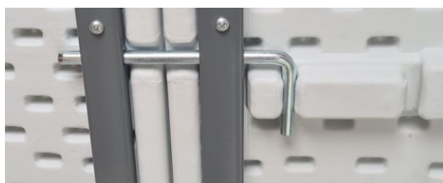
Beslag lukket – under anvendelse

Tilse at låseringene kommer helt på plads inden anvendelsen. Se herunder.