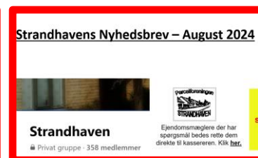
Nyhedsbrev August 2024

I vil i flere tilfælde opleve, at artikler skrevet af bestyrelsen vil fremstå på flere platforme. Strandhavens vigtigste medie er nyhedsbrevene, da alle 264 parceller modtager informationen. Facebook bruges ikke af alle, og ligeledes er det ikke alle der har adgang til Strandhavens hjemmeside.