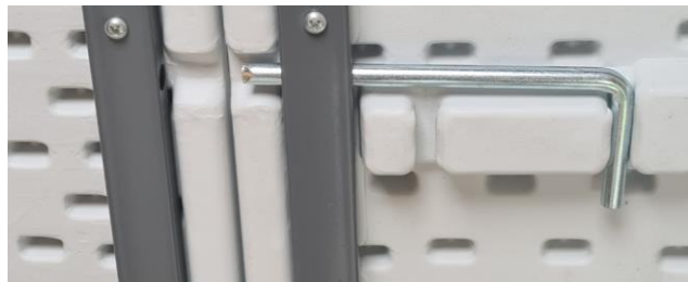
Beslag åben – under transport

Flere af bordene har 2 stk. låseanordninger på undersiden. Det er vigtigt , at låsen er lukket under anvendelse. Se herunder.